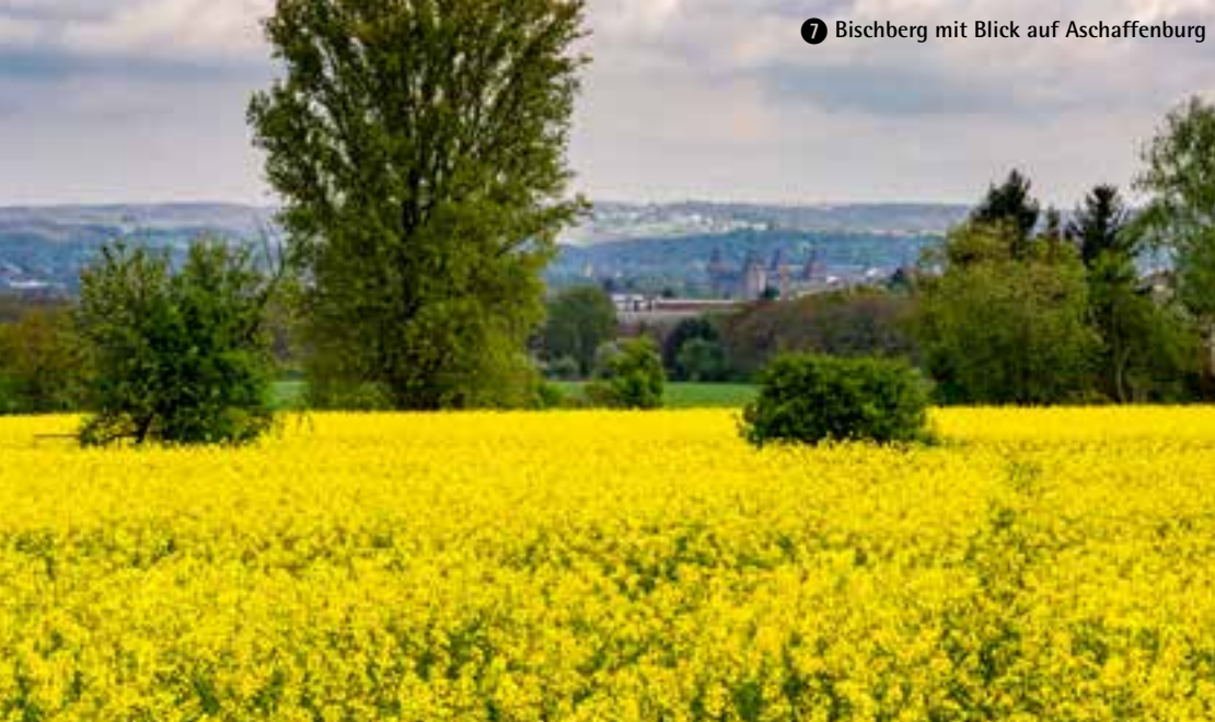
7 Bischoberg mit Blick auf Aschaffenburg

Bergauf, bergab werden auf der Gesamtstrecke 1267 Höhenmeter bewältigt. Der höchste Punkt ist mit 345 m bei Gailbach erreicht, der tiefste Punkt mit 110 m liegt am Mainufer in Mainaschaff in den Mörswiesen.