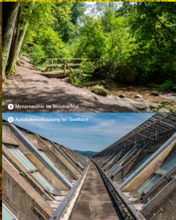
9 Menzenmühle im Steinbachtal