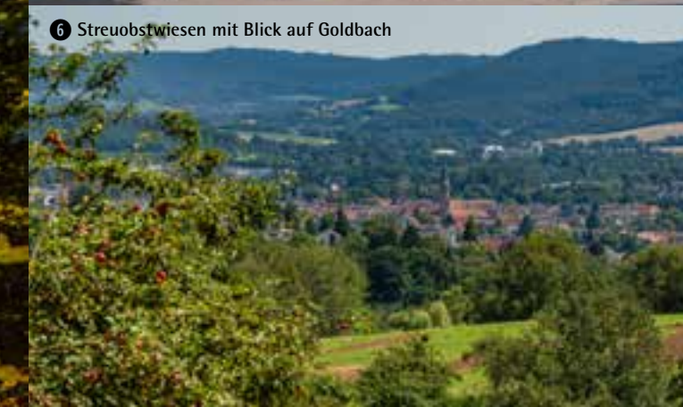
6 Streuobstwiesen mit Blick auf Goldbach