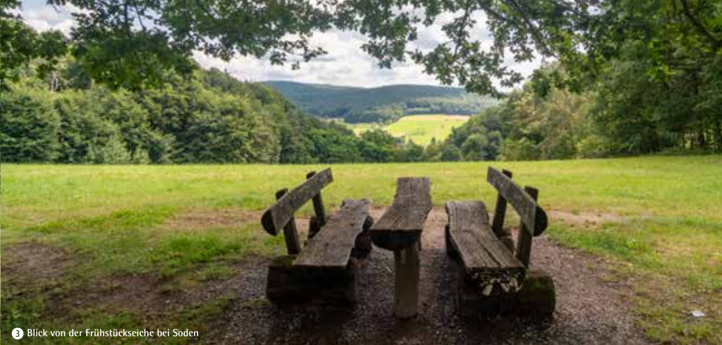
3 Blick von der Frühstückseiche bei Soden