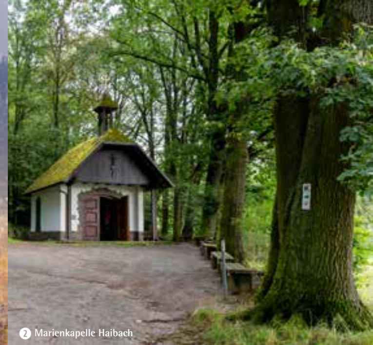
2 Marienkapelle Haibach