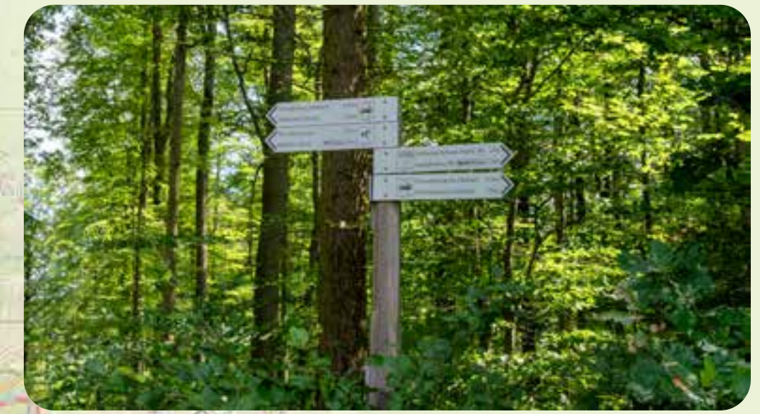
Ausschilderung an Wegkreuzungen

Zubringer Wanderweg Hauptbahnhof Richtung Ebertbrücke, Willigisbrücke oder Fasanerie Kleinostheim Richtung Strietwald