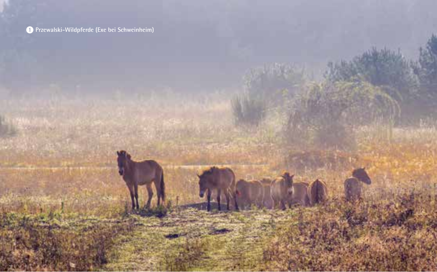
1 Przewalski-Wildpferde (Exe bei Schweinheim)