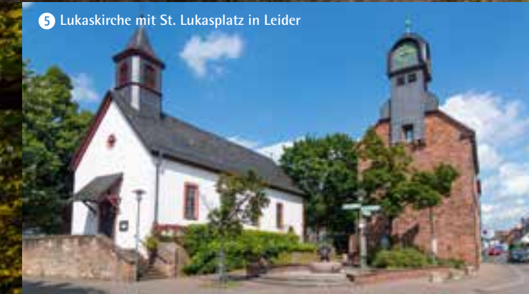
5 Lukaskirche mit St. Lukasplatz in Leider