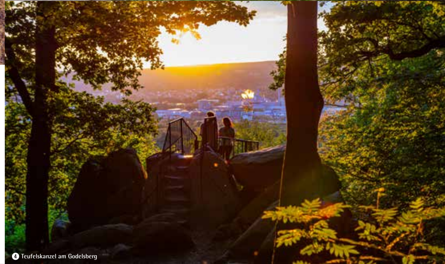
4 Teufelskanzel am Godelsberg

Rundwanderweg und Zubringerwege wurden mit den entsprechenden Markierungen von den fleißigen ehrenamtlichen Wegemarkerern des Spessartbundes versehen, so dass sich die Wanderer auch ohne Karten und Apps zurechtfinden können. Zusätzlich informieren an Wegkreuzungen Wanderwegweiser des Naturpark Spessart e. V. über den Verlauf der Route. Das Markierungszeichen ist in blau, grün und schwarz gehalten. Das Grün symbolisiert den Spessart, das Blau den Main – beide rahmen die prägnante schwarze Silhouette von Schloss Johannisburg ein.