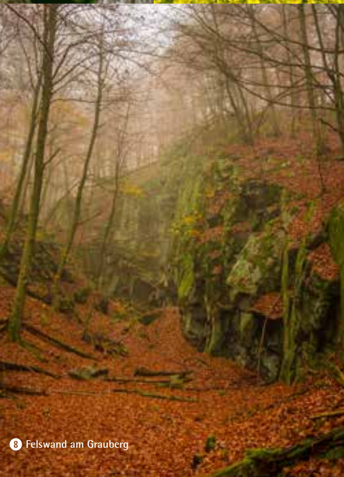
8 Felswand am Grauberg